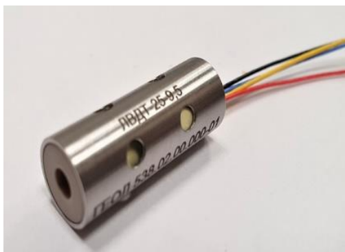
Рис. 1. Линейно-дифференциальный преобразователь перемещения LVDT