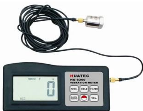
Рис. 2. Виброметр модель HG 6360

Испытание можно проводить в сухом и влажном состоянии в соответствии со следующими этапами: